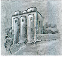
chiesa di San Marco (metà dell'XI secolo)